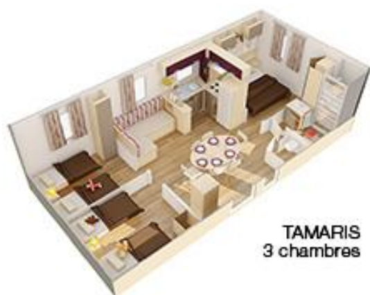
TAMARIS 3 chambres