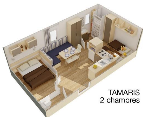
TAMARIS 2 chambres